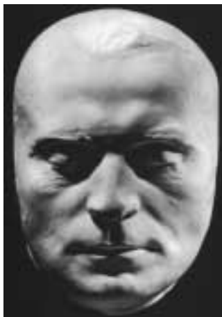
G. E. Lessing, Totenmaske

Auf der philosophischen Linie des gedoppelten Bösen von Aristoteles und Schiller und der dichterischen Linie von Lessing und Goethe konnte Rudolf Steiners Geisteswissenschaft weiterbauen. 3 Steiner enthüllte hinter den zweifachen subjektiven Abirrungen Schillers ein zweifaches objektiv und wesentlich Böses. Hinter Schillers noch abstrakt gedachtem Barbarismus (seelenloser Intellektualismus) zeigte Steiner die real-geistige Wesenheit auf, der er den Namen «Ahri-man» verlieh; hinter der «Verwilderung» (geistloses Seelisches) die Gestalt des