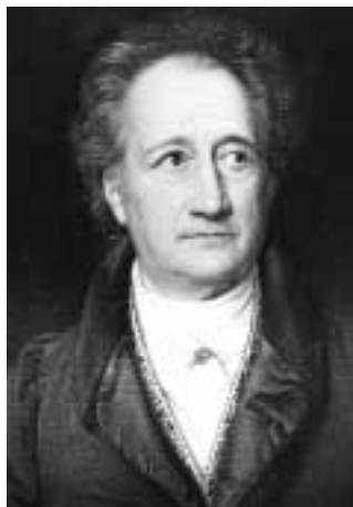
Johann Wolfgang von Goethe

Diese Ideale traten in Frankreich in tumultuarischer Weise auf und führten im Strudel der übereilten und forcierten Entwicklung zunächst zum Gegenpol