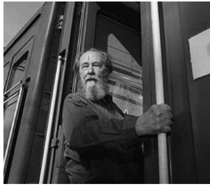
Alexander Issajewitsch Solschenizyn

Auch in der EU ist die Diskussion über die Volksvernichtungen des Kommunismus im Gange, deren Opferzahl die des Nazi-Regimes weit übersteigt.* Die Standardantwort der linken Intelligenz darauf heißt: Die beiden Fälle seien nicht zu vergleichen, denn die Volksvernichtung erfolgte im Osten nicht auf ethnischer Grundlage.