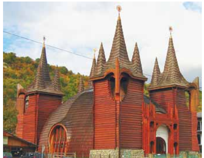
Imre Makovecz: Neu-reformierte Kirche in Cluj-Napoca (1997-2008)

intolerant. Er weiß aber, dass der Weg zum wahren Kosmopolitismus durch das Erkennen des Volksgeistes führt. Aus dem Erkennen des das andere Volk inspirierenden Geistes erwächst kein Hass, sondern Liebe und Interesse.