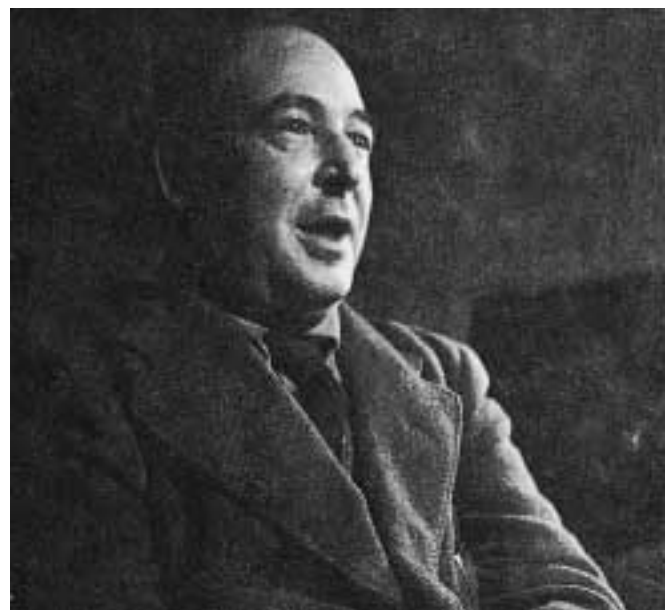
C.S. Lewis während eines Interviews mit der BBC

Drittens fegte zur damaligen Zeit die neue Psychologie durch uns alle hindurch. Wir schluckten sie zwar nicht ganz (...), doch wir waren alle von ihr beeinflusst. Am meisten beschäftigte uns die «Phantasie» oder das «wishful thinking». Denn natürlich waren wir alle Poeten und Kritiker und legten größten Wert auf «Imagination» in einem hohen Coleridge'schen Sinne, sodass es wichtig wurde, Imagination (nicht nur im Sinne Coleridges) auch von Phantasie zu unterscheiden, wie