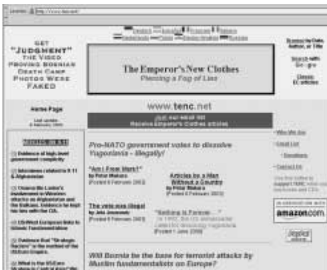
Webseite von «The Emperor's New Clothes»