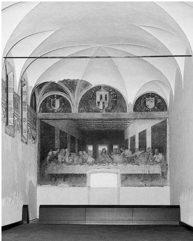
Das «Abendmahl» im Refektorium

gegen Christus und seine Jünger wollte er eine Situation herbeiführen, in dem sich die volle königliche Macht des Christus gegenüber den Verfolgern zeigen müsse, zweifellos zeigen werde. Er wollte den Sieg der Macht Christi erzwingen . Das war sein Irrtum: Er verstand die Macht Christi zu äußerlich, losgelöst von der freien Anerkennung, die ihr von der einzelnen Menschenseele erst entgegengebracht werden muss.