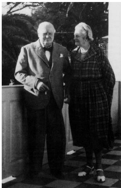
Churchill mit Gattin, im «Reid's»