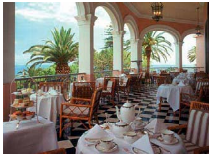
Auf der Terrasse des «Reid's»