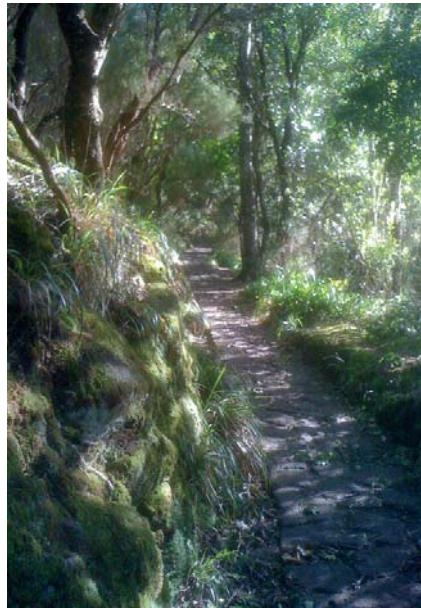
Im Lorbeerwald Madeiras

Die Gegenüberstellung von Karl I. und Winston Churchill kann dazu anregen, sich den ganz verschiedenartigen Stoff zu vergegenwärtigen, aus dem die Politik Englands – und heute der USA – gewoben ist, im Gegensatz zu der Europas, wenigstens in dessen nobleren Bestrebungen. Dieser Stoff heißt «Macht». Nicht umsonst war es Winston Churchill, der einst sagte: «Das erste Opfer des Krieges ist die Wahrheit.» Gegenüber der Machtfrage ist für den politischen Westmenschen die Wahrheit von untergeordneter Bedeutung. Wenn sich dagegen die Europäer einmal am Prinzip der Macht vergeifen, wie im Deutschland Hitlers geschehen, dann nur, um