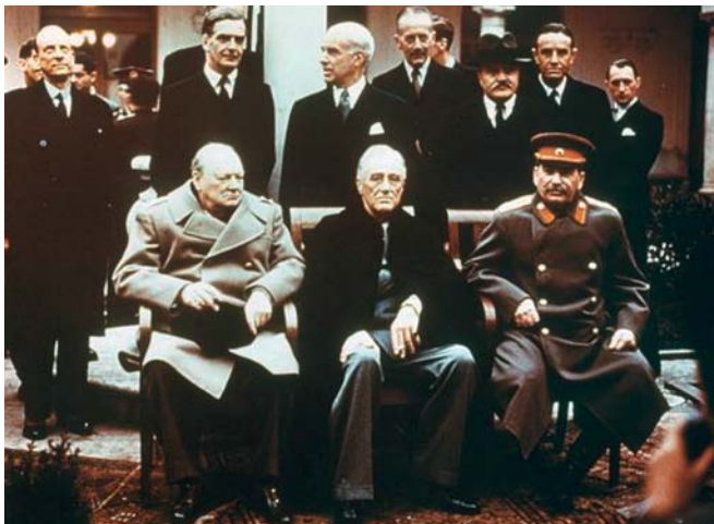
Konferenz von Jalta (Februar 1945) Churchill, Roosevelt, Stalin (hinter ihm Averell Harriman)