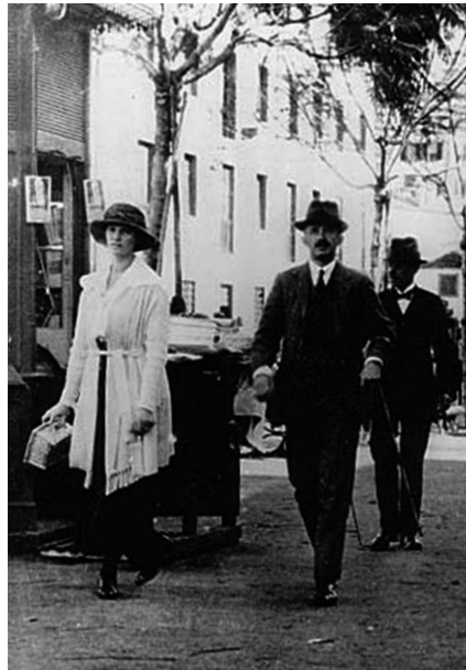
Kaiser Karl in Funchal

Das österreichische Werkzeug dazu war der ganz nach England orientierte Außenminister Czernin. Kaiser Karl musste Polzer wegen unerwiesener Vorwürfe entlassen. Später sagte der Kaiser: «Graf Polzer ist mir durch alle möglichen Intrigen entrissen worden.» Die gegen den wahren Zeitgeist arbeitenden Mächte wussten, was ihnen drohte, falls die Alternative «Dreigliederung» vom