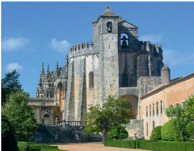
Die Templerkirche von Tomar

Stalin, Machtmenschen; mit dem Unterschied, dass die Macht der Westmenschen die Mitteleuropas und des Ostens als wahre Übermacht schließlich in ihren Dienst zu zwingen wusste.