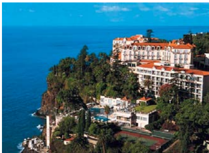
Das Hotel «Reid's»