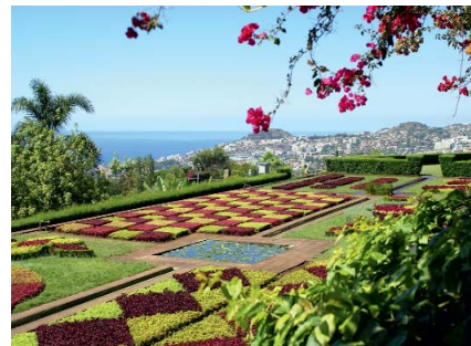
Der botanische Garten über Funchal

die im südlichen Atlantik liegende Insel St. Helena, wo er seine Memoiren schreiben sollte. Auf der Reise machte das Schiff, das ihn ins Exil führte, in Madeira Halt.