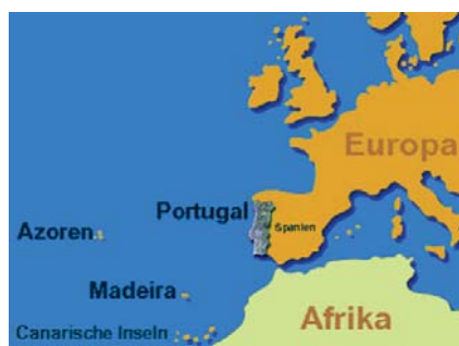
Die geographische Lage Madeiras

Als die Briten nach der Schlacht von Waterloo dafür sorgen wollten, dass Napoleon nie mehr mit einem überraschenden Comeback aufwarten konnte, verbannten sie ihn auf