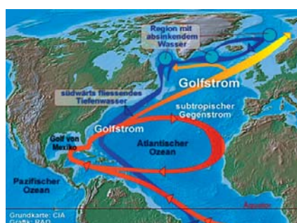
Der Verlauf des Golfstroms