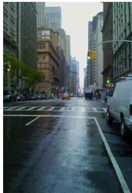
7th Avenue, links Carnegie Hall