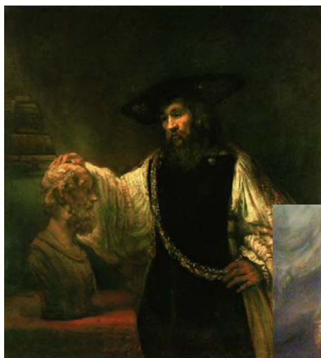
Rembrandt: Aristoteles, Homer und Alexander der Große

An den aufführungsfreien Tagen wurden Museen besucht. Als erstes das Metropolitan Museum, das einen