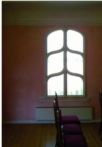
Fenster im Raum des Widar-Zweigs

Dieses Gesetz verwirklichen alle denkenden Subjekte, wenn sie wirklich denken. Es kommt in allen Denktä-