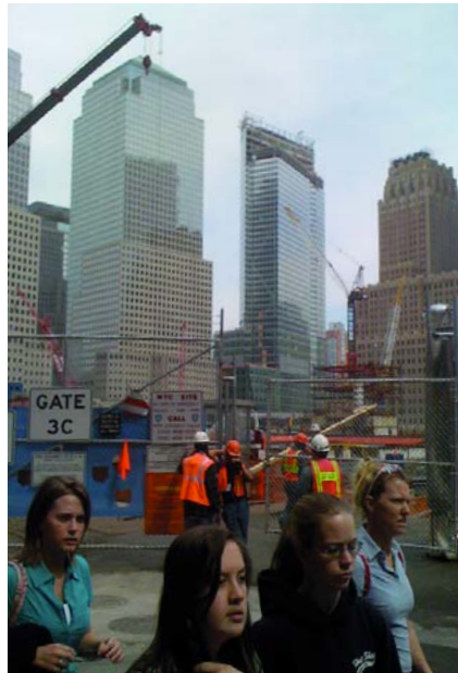
Nachdenklichkeit am Ground Zero

Erst wenn der Glaube an die den Zusammensturz der drei Gebäude angeblich verursachende Rolle der beiden Flugzeuge sowie der «islamistischen Täter» zerstört ist, kann ein wirklichkeitsgemäßes Fragen nach den wahren Hintergründen der Anschläge beginnen. Bis jetzt hat niemand zu behaupten gewagt, dass «Al Kaida» hinter der Platzierung des Sprengstoffs in den Gebäuden