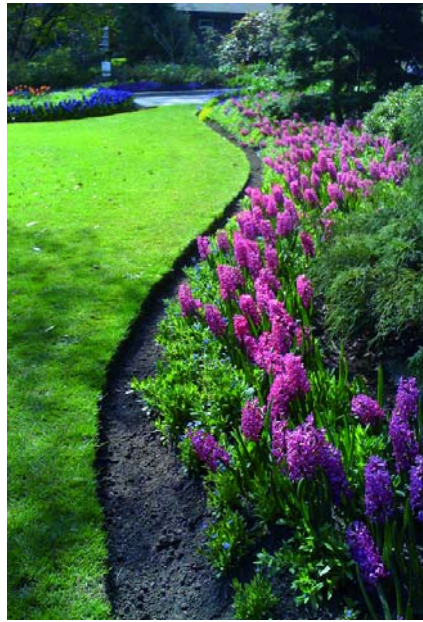
Hyazinthen im Stanley-Park

Mit Hinweis auf Steiners Helsingforscher Ausführungen zur Bhagavad Gita (GA 146) zeigte ich, dass auch in der Bewusstseinsphase des abstrakten Denkens ein letzter Rest des alten Hellsehens sowie zugleich ein