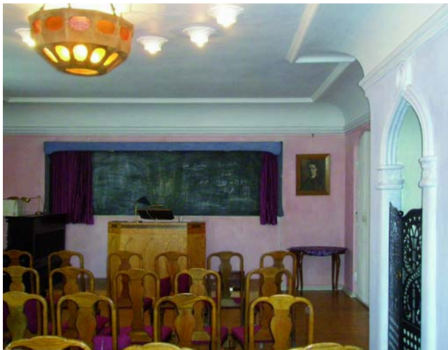
Der Raum des Widar-Zweigs

Wie löst Hartmann das Problem von Optimismus/Pessimismus?