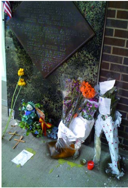
Was von der Trauer übrig blieb

Wegen des geschilderten Charakters des amerikanischen Volksgeistes, der also viele ihm untergeordnete Völkerschaften beherrscht, ist er auch mit der bevorstehenden Inkarnation Ahrimans durchaus kompatibel. Auch diese geistige Wesenheit wirkt nicht, sogar vielleicht noch weniger, auf «Weiterentwicklung» des Menschen hin. Doch auch dies geschieht aus den Absichten des Weltenplans heraus, in dem «alles gut» ist. (Siehe dazu am Ende dieses Berichtes Konkreteres.) Dieser Teil der Diskussion musste naturgemäß fragmentarisch bleiben. Es ist notwendig, dieser Eigenart des amerikanischen Volksgeistes gründlicher nachzugehen, da sonst leicht