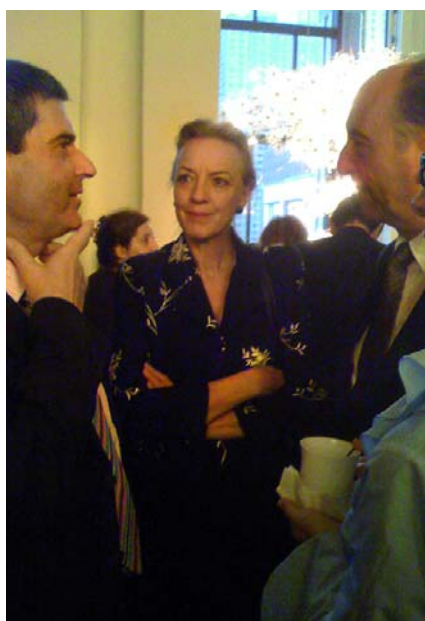
In der Met

Dieses Maß wurde im Hinblick auf das Jahr der amerikanischen Unabhängigkeitserklärung gewählt. Aufbruchswille verrät auch ein Poster im nahen Dokumentations-Zentrum: Es trägt die Aufschrift «Renewing our American Dream after 9/11». Doch welcher Traum und welche Erneuerung? Das Info-Zentrum zeigt ein paar Zeugnisse von Opfern, Hinterbliebenen und anderen Zeugen, nichts jedoch von der kriminalistischen Seite des Verbrechens. Weder die berüchtigten angeblichen islamischen Täter noch der Einsturz der Türme werden dokumentiert und kommentiert. Angesichts zahlreicher kritischer Untersuchungen in den letzten Jahren – von einer wachsenden Zahl von Ingenieuren, Architekten, Physikern und jüngst auch durch eine Gruppe von Chemikern –, scheint man in der Wahl der Exponate vorsichtig geworden zu sein. Das breite Publikum soll an die alten Erklärungen gekettet bleiben und nichts von kritischen Untersuchungen zu völlig ungelöst geblieben Kardinalfragen erfahren.