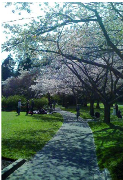
Blühen von Bäumen und Menschen