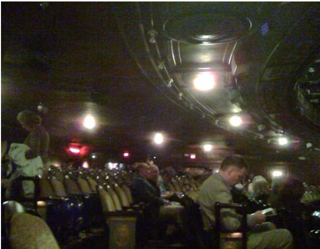
«Warten auf Godot» ...

Becketts Stück ist auf der Schwelle angesiedelt, nicht vor der Schwelle, wie Kafkas Erzählung Vor dem Gesetz . Es zeigt, was der Menschheit blüht, wenn sie den Geist entweder total verleugnet oder nicht geneigt ist, zu lernen, die Schwelle zur geistigen Welt selbsttätig und sachgemäß zu überschreiten, was allem Warten auf einen zu uns kommen sollenden Gott ein Ende setzen würde. Dies alles von einer Art Schwellen-Humor durchsetzt, welcher Erhabenstes zu Banalstem werden lässt (Luckys Monolog des karikierten menschlichen Denkens), aber auch Alltäglich-Gewöhnlichstes verkärt (Estragons poetische Augenblicke).