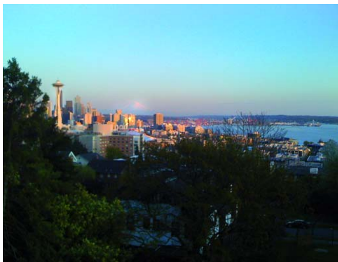
Seattle mit Mount Rainier im Hintergrund

Unterwegs vertiefte ich mich in die Lektüre von Klee Wyck , des ersten Buches der kanadischen Schriftstellerin Emily Carr (1871–1945), welche das Leben der Indianer auf Vancouver Island studierte, indem sie es mit ihnen teilte. Knapper, konziser Stil, Einblicke in die Mentalität der Urbevölkerung vermittelnd, zum Beispiel, dass das Malen eines Porträts einen unheilvollen Eingriff in die Persönlichkeit des Betroffenen darstelle: «Die alten Indianer glaubten, dass der Geist eines Menschen in einem Bildnis von ihm eingefangen würde, so dass er, darin festgehalten, nach dem Tode des betreffenden Menschen in seinem Porträt gefangen bleibt.» Was würde ein solcher Indianer zur Wirkung des Fotografierens und Fotografiertwerdens zu sagen haben? Im Übrigen ist laut der Tyrannis