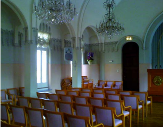
Der Vortragssaal im Nobel-Gebäude

121) schildert Steiner außerdem, dass der urindische Zeitgeist nach Erfüllung seiner Aufgabe während der indischen Epoche zum führenden Zeitgeist aller sieben nachatlantischen Kulturepochen aufgestiegen ist.