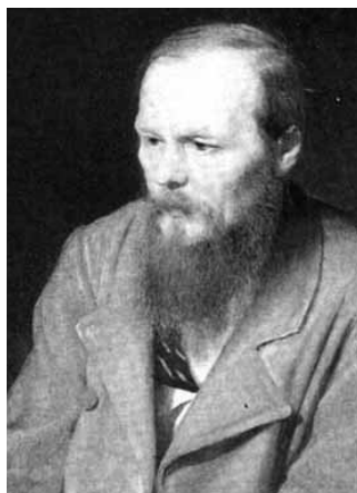
Fjodor M. Dostojewskij