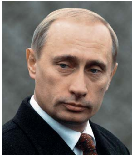
Wladimir Wladimirowitsch Putin

Sacharow – wie der Schachgroßmeister Gari Kasparow, den die putin'sche Polizei von Zeit zu Zeit ver-