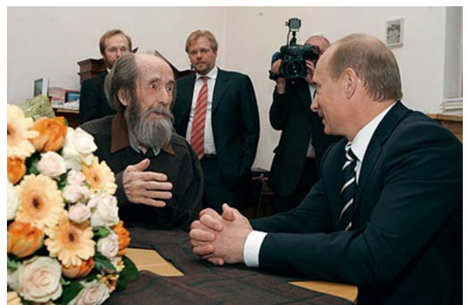
Solschenizyn und Putin 2007

weit seine Kräfte es erlaubten – selbst mit seinen Vorträgen und dem ganzen Lebenswerk diene. Putin hatte diese Aufgabe und damit auch seinen Meister erkannt, und das russische Volk ahnte es. Deshalb lebt in den Seelen der einfachen Landbewohner eine religiöse Ehrfurcht gegenüber Putin. Beobachten wir nur das in der Presse oft gezeigte Putin-Denkmal. Putin steht in dem einfachen Leinenhemd des Muschiks da, barfuß. Wir sehen Till Eulenspiegel, der sein Volk vor der Ausbeuterei der Oligarchen verteidigt. Wenn wir im Stande sind, ihn nicht mit westlichen Augen, d.h. von dem aus den geistigen Zusammenhängen herausgefallenen, emanzipierten und wurzellosen intellektuellen Gesichtspunkt aus zu betrachten, dann entfaltet sich ein großartiger Strategie und eine repräsentative Menschengestalt von großem Format. Er solle die Beeinflussungsversuche aus der Richtung Amerikas im Zaume halten, die von Seiten der intellektuellen Opposition kommen, bzw. sich in den «Orangenrevolutionen» in Georgien und in der Ukraine zeigen oder in dem Eindringen des westlichen Großkapitals. Gleichzeitig solle er gegen die militärischen Bestrebungen der USA ankämpfen, mit welchen Amerika