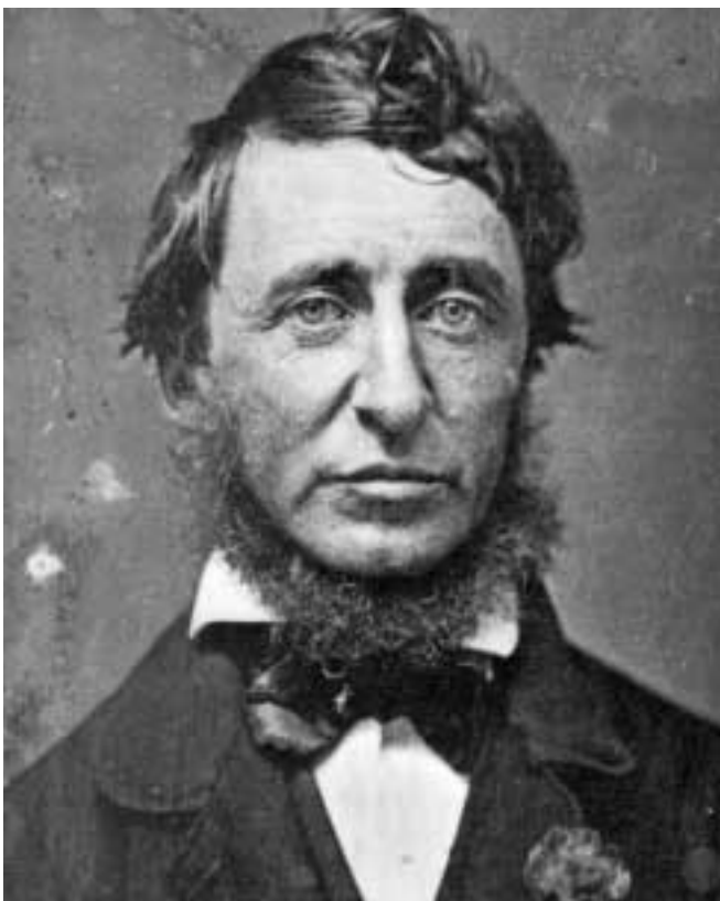
Henry David Thoreau