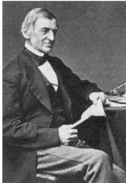
Ralph Waldo Emerson

mere idlers and vagabonds, but they who do go there are saunterers in the good sense, such as I mean. Some, however, would derive the word from sans terre, without land or a home, which, therefore, in the good sense, will mean, having no particular home, but equally at home everywhere. For this is the secret of successful sauntering. He who sits still in a house all the time may be the greatest vagrant of all, but the Saunterer, in the good sense, is no more vagrant than the meandering river, which is all the while sedulously seeking the shortest course to the sea. But I prefer the first, which indeed is the most probable derivation. For every walk is a sort of crusade, preached by some Peter the Hermit in us, to go forth and reconquer this Holy Land from the hands of the Infidels.» 6