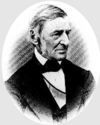
Ralph Waldo Emerson

Thoreaus praktische Fähigkeiten versorgten ihn mit dem Nötigsten zum Leben. In der Bleistiftfabrik seines Vaters verbesserte er das Herstellungsverfahren dergestalt, dass man bald einen Stift fertigen konnte, der zu den besten in Amerika gehörte. Als jemand ihm gratulierte und meinte, nun sei er ein gemachter Mann, erwiderte Thoreau, dass er das Produkt nicht weiter verbessern könne und das Leben zu wertvoll sei, als dass er den Rest davon in Bleistifte investieren würde, obwohl er doch weiterhin, wenn erforderlich, aushalf. Er arbei-