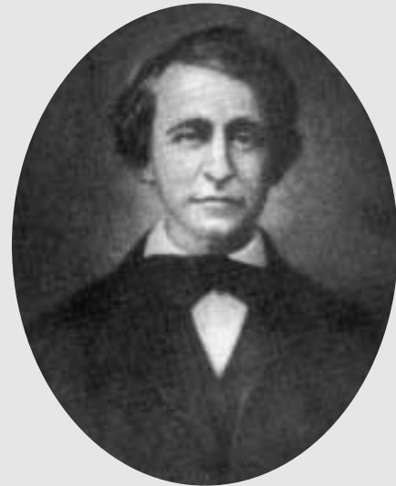
Henry David Thoreau