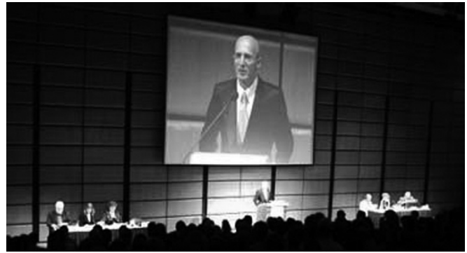
Saal im Austrian Center

Ich habe die Vereinigten Staaten verlassen und habe einen Wohnsitz in Wien und einen in Amsterdam (...) Und ich würde nur zurückkehren, wenn die Neocons