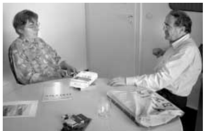
Das Interview im Münchner Büro von Wisnewski

TM: Wenn ich nochmals den Bogen zu Ihrem RAF-Buch zurückspannen darf: Sie fordern bereits dort am Ende des Vorworts Wachsamkeit gegenüber Bedrohungen der Verfassung, in Form des Zitats: «Bürger, schützt eure Verfassung!» Nun haben die Ereignisse vom 11. September ganz besonderen Anlass geboten, in den USA, aber auch etwa in Deutschland unfreiheitliche Verfassungsänderungen durchzuführen. Gegen-