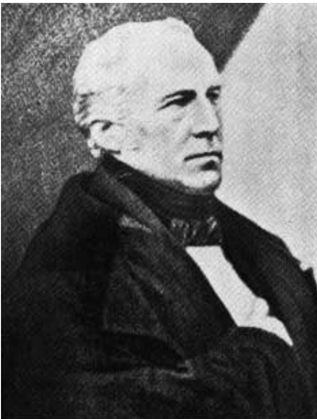
Carl Gustav Carus (1789–1869)

Die einzige persönliche Begegnung zwischen den beiden Naturforschern erfolgt am 21. Juli 1821 in Weimar zu Beginn der großen wissenschaftlichen Mittelmeerreise von Carus. Die zwei Stunden währende Begegnung, über die Carus in seinen Lebenserinnerungen ausführlich berichtet, bestätigt die außerordentliche Geistverwandtschaft dieser beiden kongenialen Persönlichkeiten in allen Gesprächsthemen (anatomische Mor-