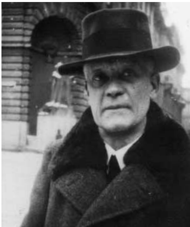
Ludwig Polzer-Hoditz (1868 – 1945)

nannte diesen seinen letzten Rückblick auf sein Leben «Schicksalsbilder aus der Zeit meiner Geistesschülerschaft». Eine vollständige Publikation dieser «Schicksalsbilder» ist für den Herbst dieses Jahres vorgesehen. Zu den in den Bildern agierenden Persönlichkeiten ist Näheres zu finden in: Th. Meyer, Ludwig Polzer-Hoditz – Ein Europäer , Basel, 1994. Hinzufügungen zwischen eckigen Klammern stammen von der Redaktion.