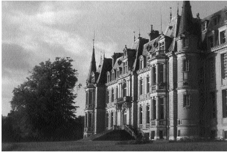
«Les Fontaines», Chantilly

Exodus nach Chantilly war, daß ihr neu errichtetes Pariser Zentrum für eine Generalversammlung zu klein sei.