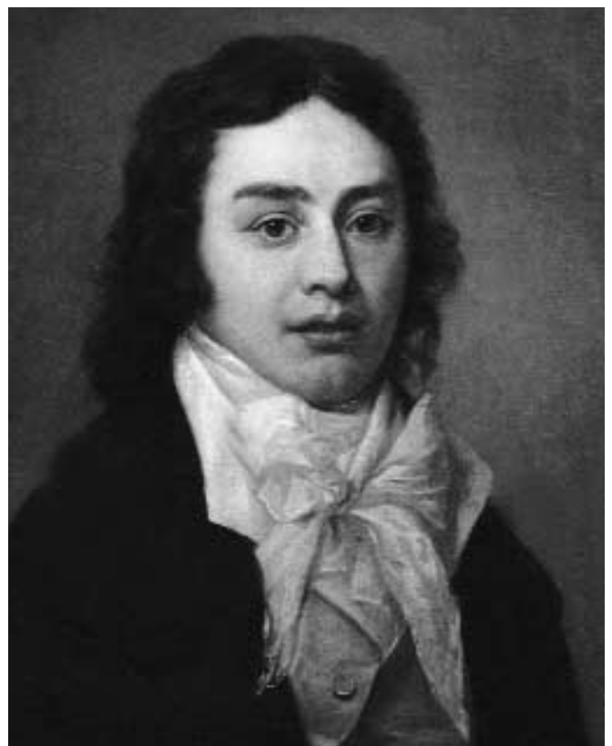
S. T. Coleridge, 1772–1834