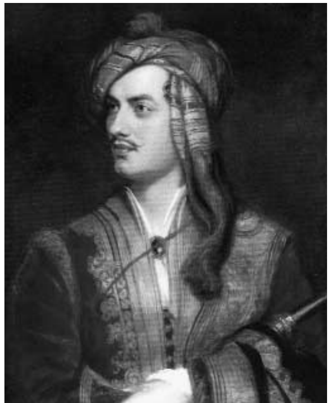
Lord Byron, 1788–1824