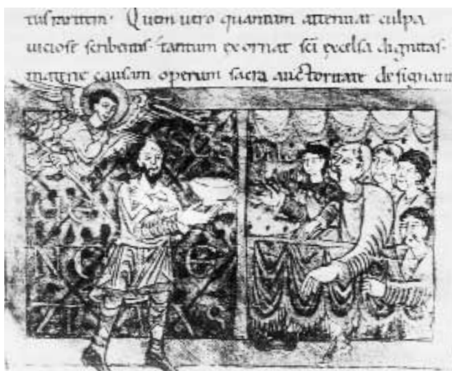
Wenzel feiert das Michaels-Fest (Gumpold-Legende, Wolfenbüttler Handschrift, Herzog-August-Bibliothek, Wolfenbüttel)

Die lateinischen Legenden schildern Wenzel als wahren christlichen Märtyrer: Als ihm ein Pferd zur Flucht angeboten