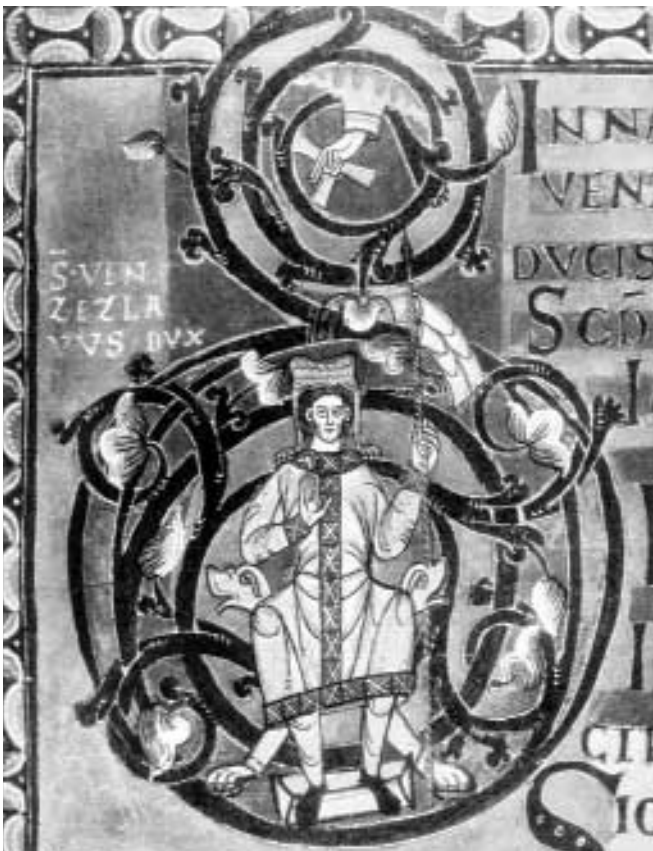
Illustration des hl. Wenzel (Visegrad Kodex, Evangeliar des Königs Vratislav, Ende des 11. Jhs., Nationalbibliothek Prag)

Ohne mit der slavischen Tradition zu brechen, verknüpfte Wenzel sein Land eng mit dem deutschen Westen. Er hatte sich in dem Streit zwischen Sachsen und Baiern um die Reichsherrschaft für den sächsischen König Heinrich I. (909–936) entschieden und empfing dafür aus den Händen Heinrichs eine Reliquie des sächsischen Heiligen Veit (tschechisch: Vít), dem der Kirchenbau auf der Prager Burg geweiht wurde. Der Mönch Christian, selbst der mährisch-slavischen Tradition nahestehend, hebt die «glückliche Freundschaft» zwischen Heinrich und Wenzel hervor. 13