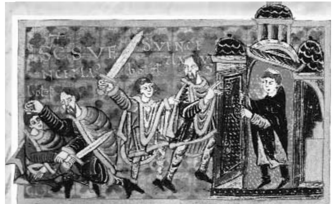
Ermordung des hl. Wenzel (Gumpold-Legende, Wolfenbüttler Handschrift, Herzog-August-Bibliothek, Wolfenbüttel)

geschichte, hrsg. u. übers. v. Reinhold Rau, Darmstadt 1962, Bd. III, S. 163.