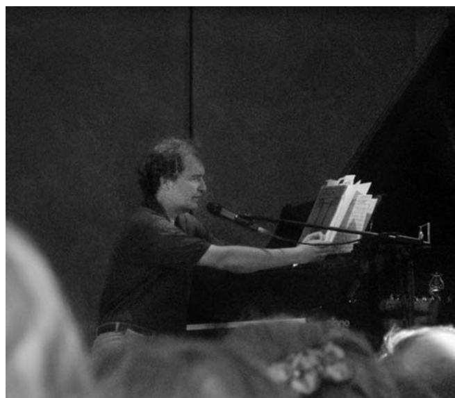
In Aktion ...

TM: Steiner macht auch darauf aufmerksam, dass ein künftiges Christuserleben zunächst nur musikalisch ausdrückbar sei, und weist in diesem Zusammenhang in Torquay (1924) auf die Tonfolge des Abendmahlsmotivs des Parsifal hin.