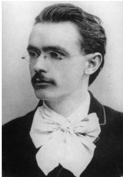
Rudolf Steiner (1861–1925), um 1888

hatten, daß es bei Steiner gewisse «rassistische» Tendenzen geben könnte und dass man sich von ihnen nun energisch «distanziere». 8 Was in Holland anfang, erreichte in Dornach einen Höhepunkt: Die Allgemeine Anthroposophische Gesellschaft hat sich durch diese Vorgänge in bezug auf die sachliche Verteidigung der Rassismus- und Antisemitismusvorwürfe gegen die Anthroposophie R. Steiners selbst schachtmatt gesetzt. Es ist dabei ein auffälliges Faktum, daß diese gravierende Einladung vom Dornacher Vorstand der AAG und dessen Vorsitzendem nicht nur gebilligt worden ist, sondern auch ohne jegliche aktive Teilnahme, vorherige oder nachherige Stellungnahme von seiten dieses Vorstands abgehalten wurde. Man kann also gegenwärtig Mitglied resp. Vorsitzender eines sich so nennenden Initiativ-Vorstandes der AAG sein und weitgehenden, der Sache der Geisteswissenschaft Schaden zufügenden, weil auf keiner Wahrheitsbasis stehenden Zugeständnissen an Gegner im eigenen Hause tatenlos zusehen. Diese Tatsache gehört auch zum Gesamtkomplex dazu und kann in verschiedener Richtung zu denken geben.